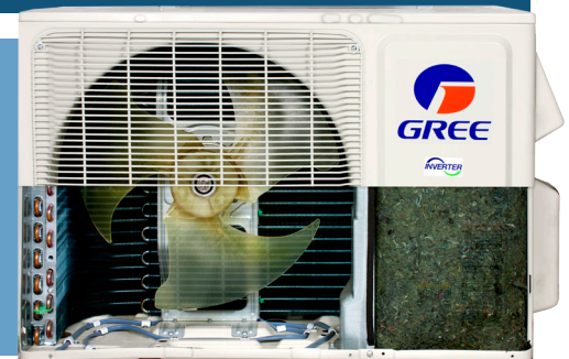
base avec élément chauffant

GREE équipe l'unité extérieure de la LOMO 23 d'une base avec élément chauffant qui empêche le gel de condensat et assure la pleine efficacité de l'appareil et une puissance de chauffage maximale.